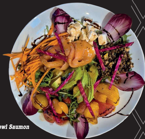
Poke Bowl Saumon