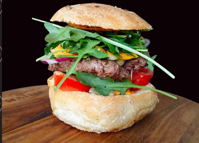
Le pain Burger est fabriqué par la Boulangerie Ouvrard de St André de la Marche.