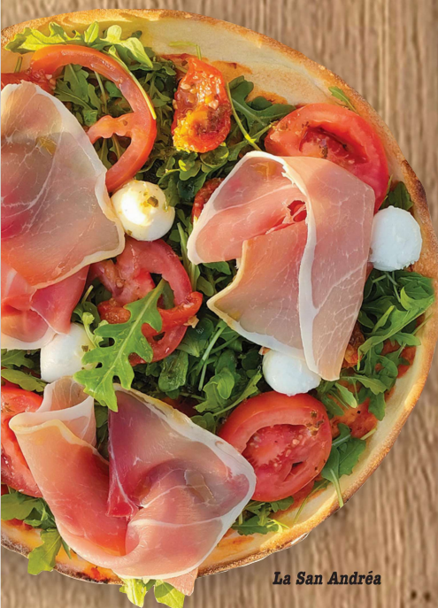
La San Andréa