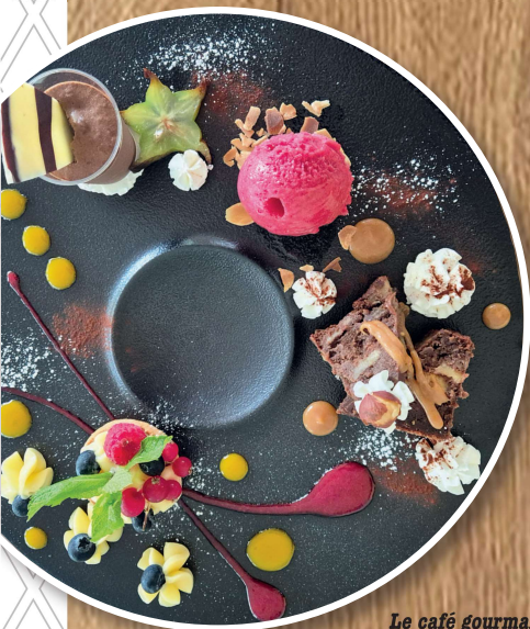
Le café gourmand

Les desserts du Menu à l'Ardoise sont disponibles à la carte.